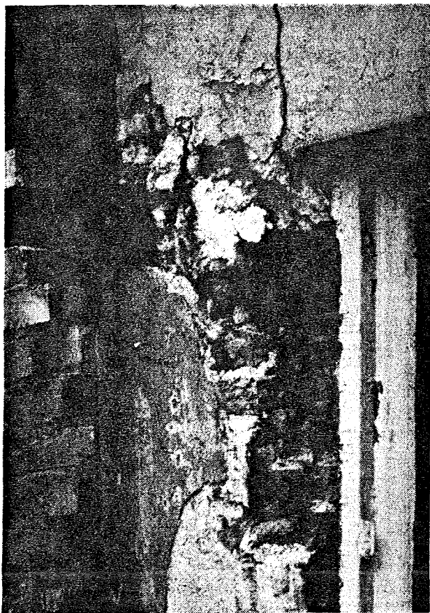
Billedet, der er taget udefra, viser det odelagte Murværk ved Vinduesaabningens Overkant. Ved Siden ses den nyopmurede Klinkerpille.